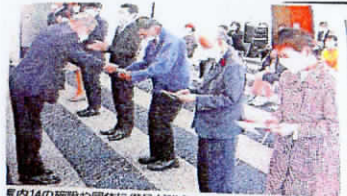
県内14の高齢や団体に贈られた山新放送愛の事業団 寄贈援助・助成贈呈式 ＝山形市・山形メディアタワー